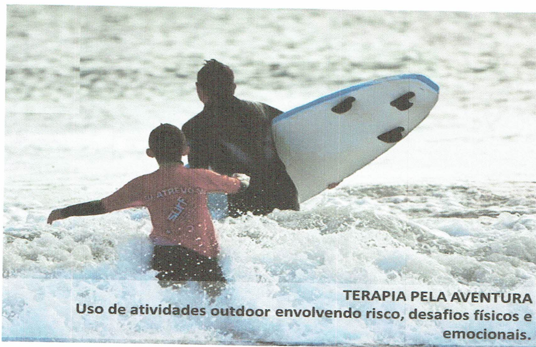
TERAPIA PELA AVENTURA Uso de atividades outdoor envolvendo risco, desafios físicos e emocionais.

A par das atividades específicas elaboradas para este plano iremos também, contemplar atividades gerais para as épocas festivas, feriados e comemoração de aniversários assim como, atividades lúdico-pedagógicas no período de pausas letivas e fins-de-semana como o Surf e Bodyboard, sendo estas consideradas como terapia pela aventura com benefícios físicos e emocionais para as crianças.